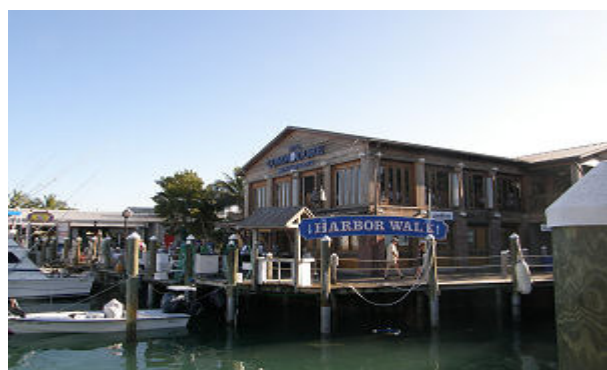
Das historische Hafenviertel - Key West