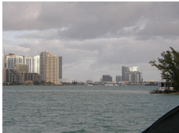
Blick auf Down Town Miami vom Ankerplatz Marine Stadion

10.02. Heute steht uns eine lange Etappe bevor, wir wollen es bis nach Key Largo schaffen.