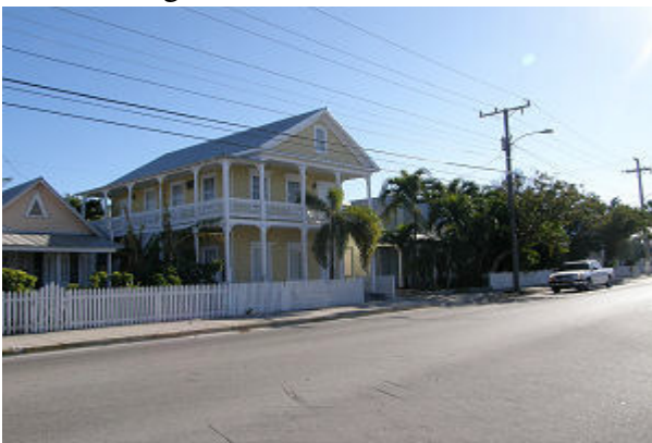
Eines der schönen Holzhäuser im kolonialem Stil.

Den Rest des Tages schlendern wir durch das wirklich schöne historische Viertel von Key West mit seinen alten Holzhäusern im Kolonialstil, verschicken noch einige e-mails und Postkarten. Nachdem der Außenborder wieder so schlecht anspringt besorge ich noch neues Benzin, vielleicht liegt es ja daran obwohl ich den Tank erst in Palm Beach gefüllt habe und um 17 Uhr legen wir von unserer Mooringboje ab. Bei Sonnenuntergang sind wir raus aus dem Ansteuerungskanal, die letzte Fahrwassertonne haben wir hinter uns.