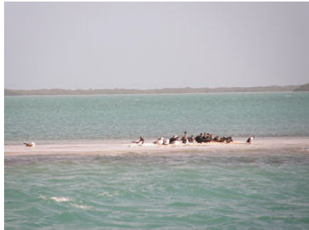
Durchfahrt zwischen Mangroveninseln und Sandbänken im Intra Costal Waterway die Florida Key's entlang.