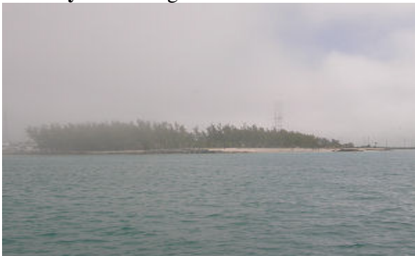
Die südwestlichste Ecke von Key West im Nebel

Alle Wassertank's wurden noch aufgefüllt und dann legten wir im Hafen ab. Als Liegeplatz hatten wir uns das städtische Mooringfeld in einer sehr geschützten Bucht nahe dem Zentrum von Key West ausgesucht.