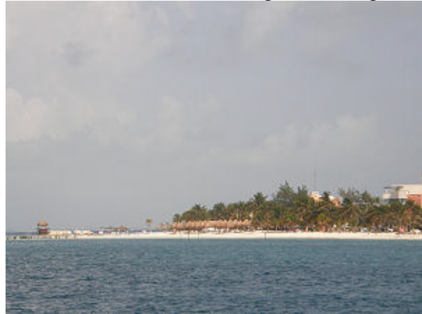
Ein letzter Blick auf die Isla Mujeres mit seinen bunten Häusern und dem "Nord-Strand".

Für Miriam ist dies der erste Segeltörn und Sie hält sich tapfer, zwischendurch legt Sie und auch Tamara ein kleines Nickerchen ein. Bereits um 15 Uhr stehen wir vor der Riffpassage zum Puerto Morelos und kurz darauf hängen wir fest an einer der dortigen Bojen vor der kleinen Ortschaft.