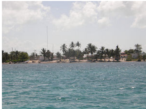
Eine sehr knifflige Riffpassage, wir Anker über 1,6 m Wasser, das Haus mit der Funkantenne ist die Capitaneria.

Nachdem wir vor der Ortschaft geankert hatten gab es erst mal ein ordentliches Frühstück.