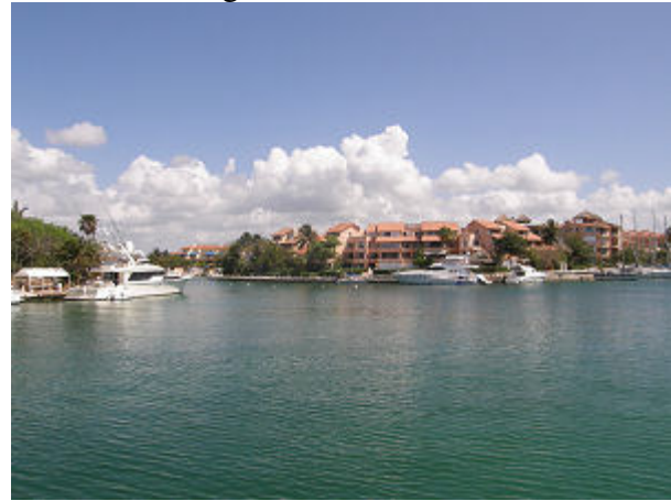
Hafeneinfahrt von Puerto Aventuras bei sehr ruhigem Wetter, im Hafen erinnert man sich an das Mittelmeer.

Plötzlich ist man in einer Südeuropäischen Atmosphäre, der Hafen Puerto Aventuras könnte auch irgendwo im Mittelmeer sein. Im Hafenbecken sind Moorings ausgelegt, an denen man mit dem Bug fest macht, mit dem Heck legt man an der Hafenmauer bzw. am Steg an. Der Hafen hat mehrere Finger und liegt mitten in einer großen und sehr gepflegten Wohnanlage, wobei zu sehr vielen Wohnungen auch ein eigener Bootsanleger gehört. Wir waren von dem Ambiente sofort sehr angetan zumal auch die Preise dort sehr moderat sind. Bei einem ersten Rundgang durch den weitläufigen Hafen entdeckten wir auch einen Italienischen Spezialitätenladen der täglich ab 09 Uhr frische und sehr gute Brötchen hat, nicht dieses weiche, weiße amerikanische Zeug. An den folgenden Tagen gab es somit immer frische Semmeln und Baguette zum Frühstück - was für ein Luxus nach 5 Monaten an Bord.