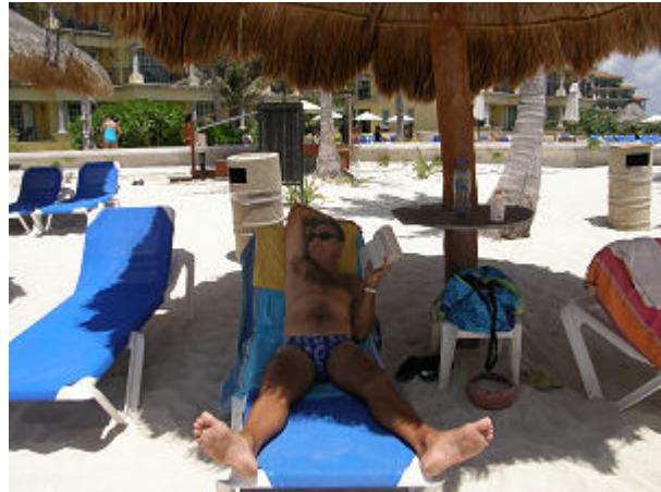
An einer Boje in Puerto Morelos, vor uns bricht das Riff die Wellen, der Kaptain beim Relaxen im "El Cid"