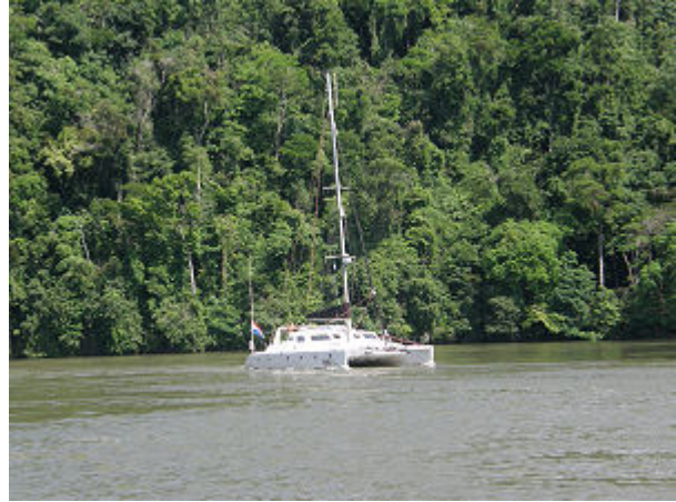
Die Fahrt den Rio Dulce hoch bietet immer wieder eine eindrucksvolle Kulisse - die "Dual Dragons" hinter uns.