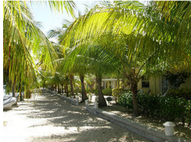
Der Strand zur Ankerbucht in Placentia, gleich dahinter ein malerischer Fußweg.