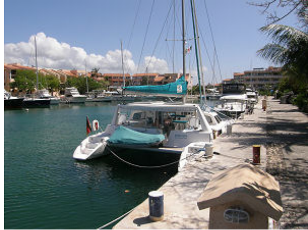
Die schmale und nicht einfach zu fahrende Hafeneinfahrt von Puerto Aventuras, drinnen liegt man super geschützt und ruhig.

Kurz darauf waren wir auch schon durch, alles lief wie geschmiert und die halbe Minute, die wir für die Durchfahrt brauchten, haben die Motoren auch durchgehalten.