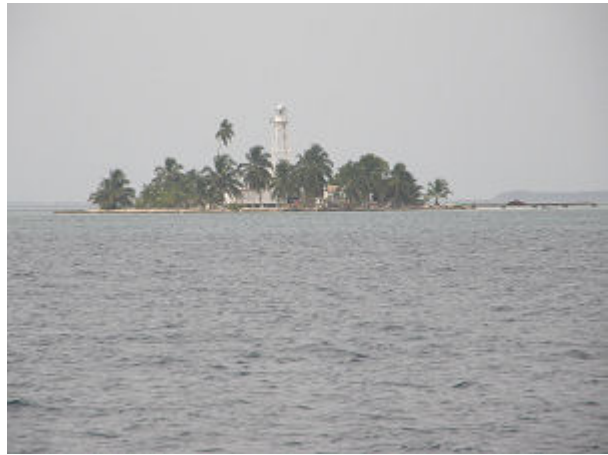
Leider im Dunst und ohne Sonne, Sandy Island und English Cay mit Leuchtturm, dazwischen verläuft der Eastern Channel.

Wir sind ein Schiff in Transit , das heißt, wir sind auf dem Weg nach Mexico und wollen uns nicht in Belize aufhalten, wir werden höchstens über Nacht irgendwo zum Schlafen ankern und am nächsten Tag weiter segeln. Deswegen brauchten wir uns auch nicht bei den Behörden in Belize melden und Einklarieren.