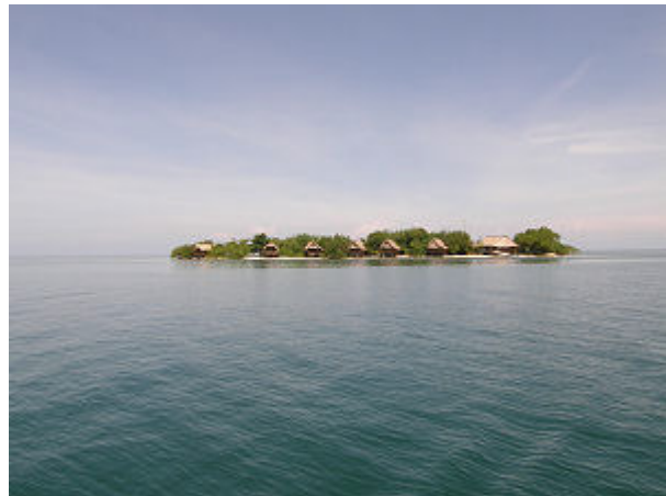
Das Inselchen Moho Cay