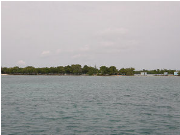
Schöne Inselwelt in Belize - unser Ankerplatz vor Blue Field Range

In 30 Std. sind wir die 235 sm von Puerto Aventuras in Mexico bis hierher gesegelt, das ist ein sehr guter Schnitt. Es gibt nur noch kurz was zu Essen, dann fallen wir auch schon in die Koje.