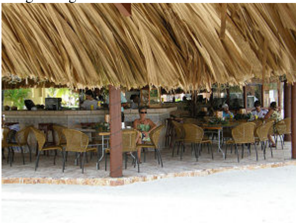
Das Restaurant direkt an der schönen natürlichen Lagune.

Die Anlage Parrot Tree ist ein sehr gepflegtes Ferienresort und liegt in einer rundum geschützten Bucht, das Restaurant wird sehr gelobt und es gibt in einer eigenen Lagune einen traumhaften Badestrand mit weißem Sand. Das war auch wieder mal was fürs Auge nach einigen Tagen in La Ceiba und über eine Woche im Old French Harbour.