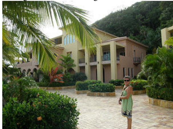
Erster Spaziergang in der schönen Anlage

Die Anlage Parrot Tree ist ein sehr gepflegtes Ferienresort und liegt in einer rundum geschützten Bucht, das Restaurant wird sehr gelobt und es gibt in einer eigenen Lagune einen traumhaften Badestrand mit weißem Sand. Das war auch wieder mal was fürs Auge nach einigen Tagen in La Ceiba und über eine Woche im Old French Harbour.