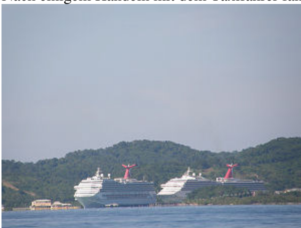
2 Carnivals in ihrem "eigenen kleinen Hafen"

Der Himmel hellt für ein paar Stunden auf, nix wie runter vom Schiff, wir machen mit Lissy und Hubert zusammen einen Ausflug in die Hauptstadt der Insel Roatan nach Coxen Hole . Nach einigem Handeln mit dem Taxifahrer fahren wir fast zum Einheimischenpreis.