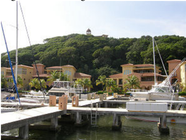
Blick von Bord am Steg

Den Ankerplatz in der Bucht von Old French Harbour hatten wir dann am 31.12. noch vor dem Frühstück verlassen, da zu sehen war, dass außerhalb des Riff's sehr ruhiges Wasser war, gegen das wir anfahren mussten. Die knapp 2,5 sm bis zur Second Bight , in der die kleine Marina liegt, waren schnell geschafft und schon um 09 Uhr lagen wir fest am Steg.