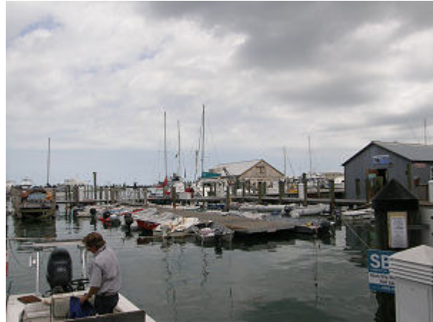
Das teure Dingi-Dock im Hafen von Key West.

Nachdem wir dann noch die "TiTaRo" aufgeklart und wenigstens die Fenster und das Cockpit vom Salzspray befreit hatten, kam das Dingi ins Wasser und wir machten uns auf den Weg in die Stadt. In Key West gibt es nur ein einziges Dingi-Dock für die Ankerlieger , dieses ist in dem einzigen Hafen, in dem 4 Marinas untergebracht sind. Diese Monopolstellung wird gnadenlos ausgenutzt, das Festmachen am Dingisteg kostet 6 $ pro Tag, 2 Stunden sind frei, aber was sind schon 2 Stunden.