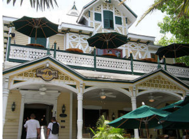
Mächtige alte Bäume, wie hier vor dem Postamt Ein Hamburger im "Hard Rock Cafe", schmeckt immer wieder gut

Beim Bummeln durch die Strassen und Geschäfte sind mir aber dann genau die Menschen zu Hauf über den Weg gelaufen, die ich eigentlich nicht sehen wollte - Kreuzfahrt Touristen!! Es sind zu 90 % Amerikaner im fortgeschrittenen Rentenalter, man erkennt sie sofort, sie sehen alle gleich aus. Entweder sind sie ausgehungert und ausgedörrt oder sie haben bis zu 100 % Übergewicht. Wenn ich dann einige 100 dieser fetten Ärsche und Oberschenkel in hautengen kurzen Hosen vor mir her schwabbeln gesehen habe, dann reicht es mir, dann will ich weg!!! Zurück im Hafen, wo unser Dingi wieder für 6 $ lag, hab ich uns schnell den neuesten Wetterbericht besorgt und sofort war klar, morgen segeln wir weiter.