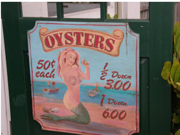
Entlang des Holzsteges im Hafen von Key West - Werbung mal ganz anders

Zurück in der Stadt haben wir noch beim Supermarkt vorbei geschaut. Die 3 Tage Überfahrt haben die Knochen steif werden lassen, wir wollten daher zu Fuß zurück zum Hafen gehen. Leider haben wir den Touristen-Stadtplan falsch gelesen und haben uns tatsächlich verlaufen, es wurde dann doch ein etwas längerer Spaziergang. Bis wir wieder an Bord waren, war es dann auch schon wieder 17 Uhr.