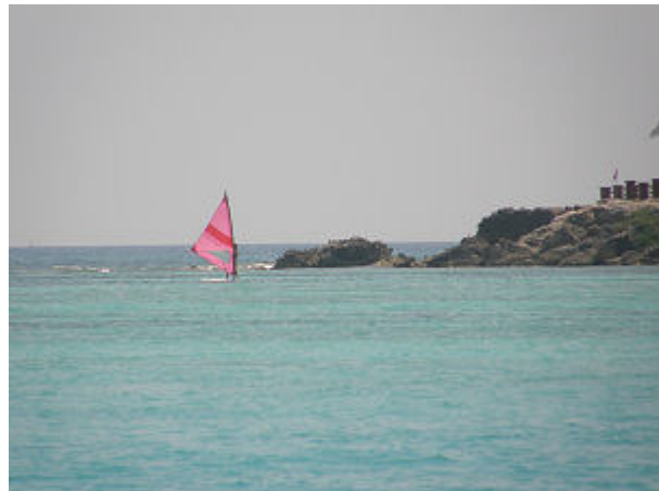
Ein letzter Blick auf die Nordspitze der Isla Mujeres mit der Riffdurchfahrt zum tiefen Wasser im Norden.

Durch die nördliche Rifffassage verlassen wir die Insel der Frauen und als wir das tiefere Wasser der Karibischen See erreichen, setzen wir die Segel. Einige Meilen von der Abdeckung der Insel entfernt weht tatsächlich ein angenehmer Süd-Ost Wind. Jetzt segeln wir erst einen Kurs soviel östlich, wie es der Wind zulässt, ich suche den viel gepriesenen Golfstrom, der hier derzeit nach Nord-Nordost laufen soll. Nach etwa 1 Stunde bemerke ich, dass uns die Strömung aus unserem fast östlichen Kurs raus versetzt, leicht nach Nord. Wir haben den Golfstrom erreicht. Ich behalte unseren Kurs bei und mit jeder Seemeile, die wir in östliche Richtung segeln wird die Strömung stärker.