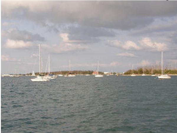
Unser Ankerplatz in Key West.

werden, wir haben wieder mal 1 Stunde hergeschenkt.