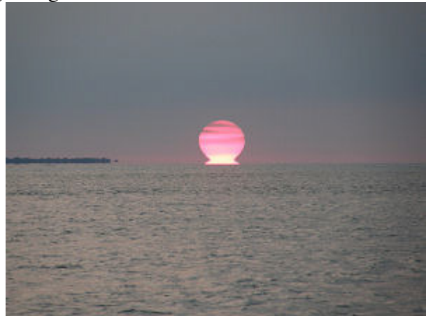
Obligatorisch: Die berühmten Sonnenuntergänge von Key West an den beiden Abenden, wo wir dort geankert haben.

In den Florida Key's gibt es viele schöne Plätzchen, da müssen wir nicht in Key West rum hängen. Wir hatten vorher schon beschlossen, dass unser nächster Stop in Marathon sein wird, die Insel neben der berühmten 7 Miles Bridge . Also nix wie hin!!