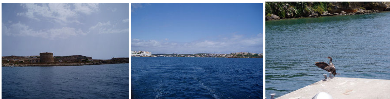
Die Einfahrt nach Mahon mit den alten Wehranlagen, der lange Hafenschlauch und ein Besucher am Schwimmsteg

Unser Ziel, die Balearen war jedoch immer präsent und nachdem wir eine Wettervorhersage mit für uns günstigem Wind für den 07. und 08. hatten, haben wir den schönen Ort Carloforte am 07.07. um 06 Uhr mit Kurs Mahon verlassen. Frühstück gab es dann unterwegs und um 08 Uhr kam auch schon der Wind und wir konnten Segeln. Wir sind gesegelt bis 21 Uhr, dann ist unser Freund, der Wind schlafen gegangen, die Maschinen mussten arbeiten bis zum Hafen von Mahon.