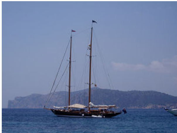
Die Ankerbucht von Santa Ponsa, hier liegen wir jetzt, am Buchteingang liegt die Ashanti IV, ein Traum von Schiff

Von Rosignano bis hierher nach Mallorca haben wir 670 Seemeilen zurückgelegt, dafür waren wir fast 120 Stunden auf See, 4 Nachtfahrten waren dabei.