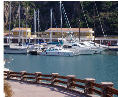
Castellsardo, Ansicht von See kommend, die Rückseite von Land sieht so aus und hier im Hafen sind wir gelegen.

Wir schlendern ein wenig durch den Ort und füllen unseren Bestand an frischen Lebensmitteln wieder auf, den Aufstieg bis nach oben zum Castell schenken wir uns, viel zu heiß.