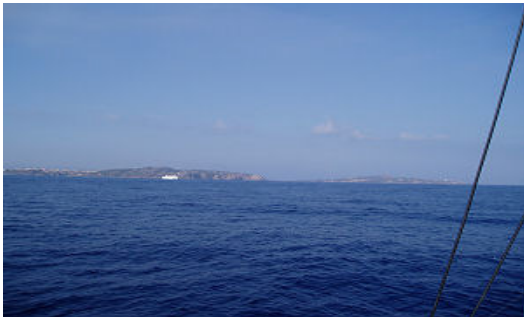
Einfahrt in die Strasse von Bonifati0