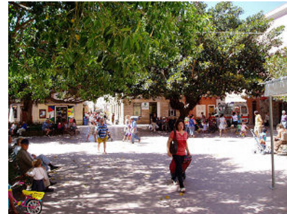
Die Uferpromenade mit Palmen und Oleanderbäumen, die engen Gassen und der Marktplatz, Treffpunkt ab Mittags.

Bis zum 07.07. sind wir geblieben in dem wirklich idyllischen Ort und haben in den engen Gassen so ziemlich alles erkundet. Täglich Mittags war offensichtlich das große Treffen der einheimischen