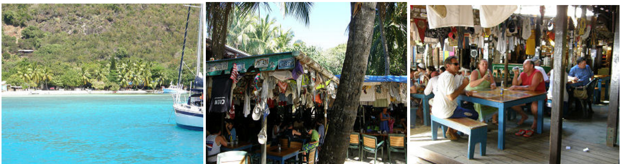
Blick von Bord auf die Bucht