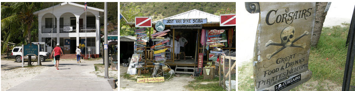
Immigration und Zoll auf Jost v. Dyke, ein typischer Touristen- + Tauchshop und ein Wegweiser zur nächsten Bar

Für unseren Geschmack reicht hier ein Tag vor Anker und wir klarieren noch am Nachmittag aus denn von hier aus wollen wir weiter segeln nach Puerto Rico .