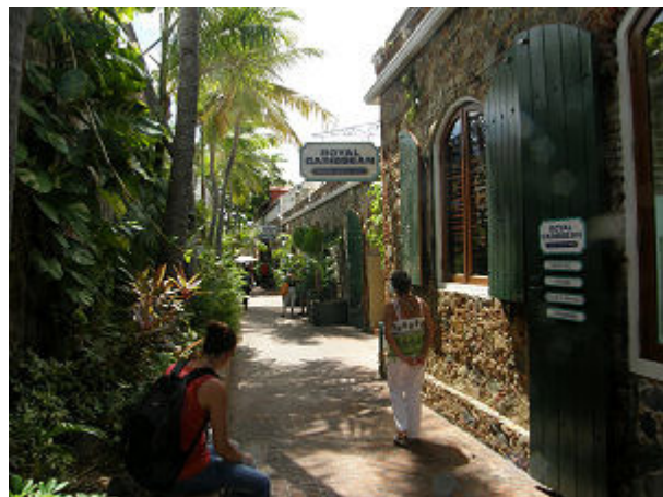
Die schönen engen Gassen zwischen den alten Lagerhallen